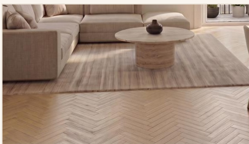
BODEN · WOHNEN & SCHLAFEN