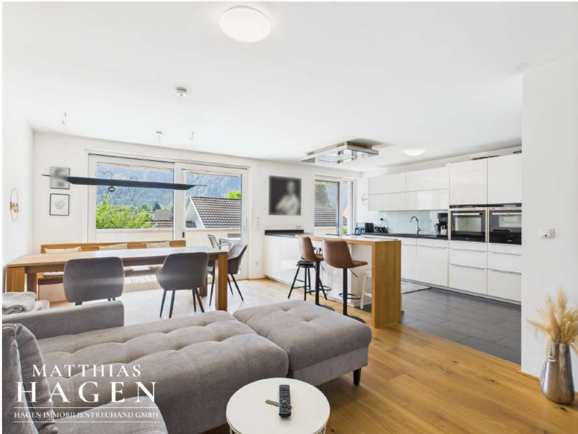
Wohnbereich und Küche