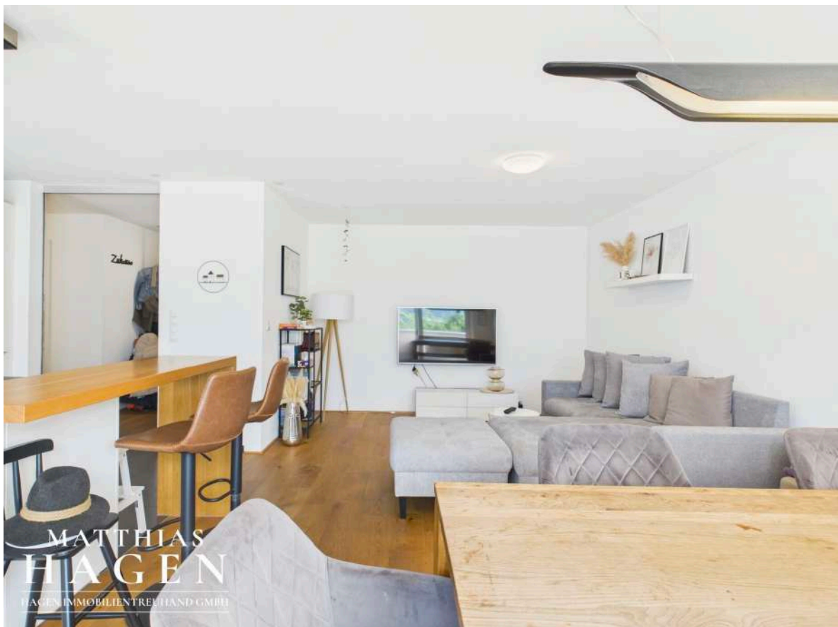
Wohnbereich und Küche

MATTHIAS HAGEN HAGEN IMMOBILIENTREUHAND GMBH