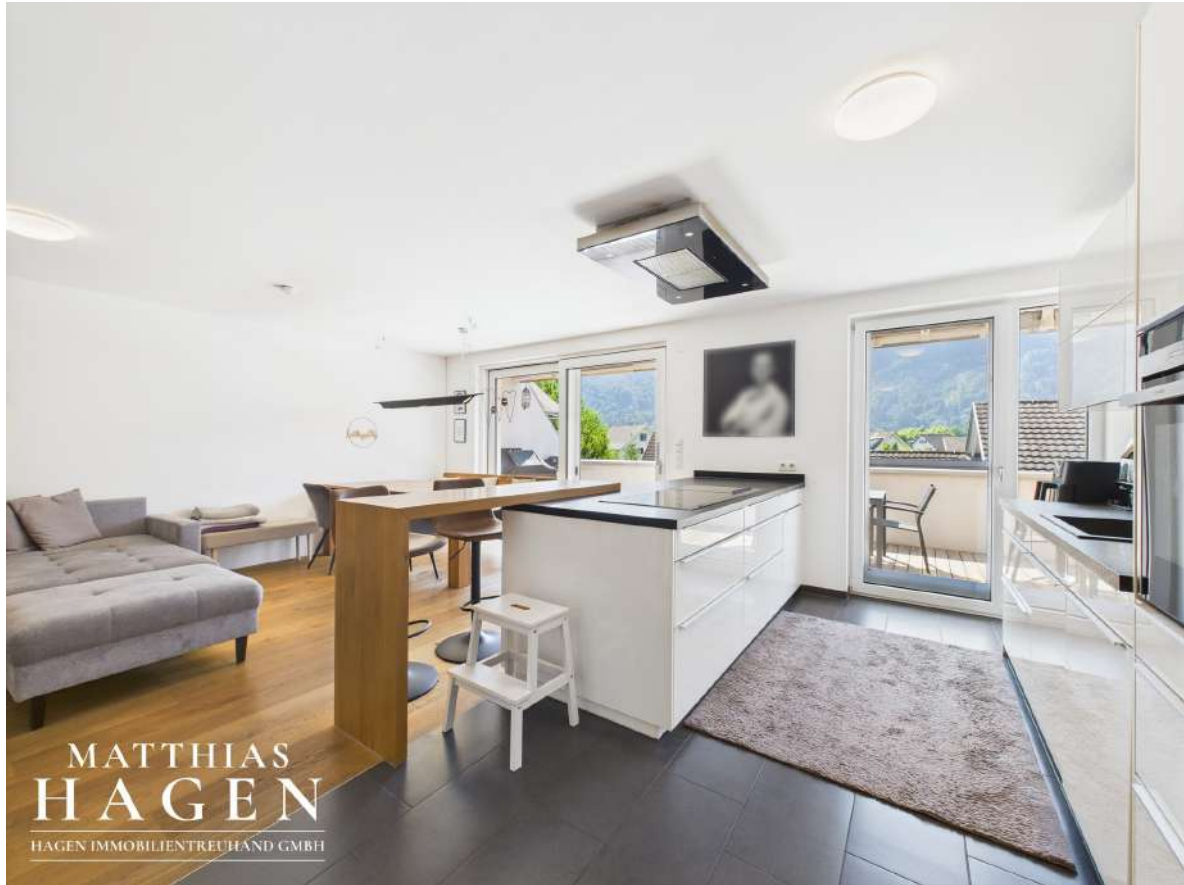
Wohnbereich und Küche