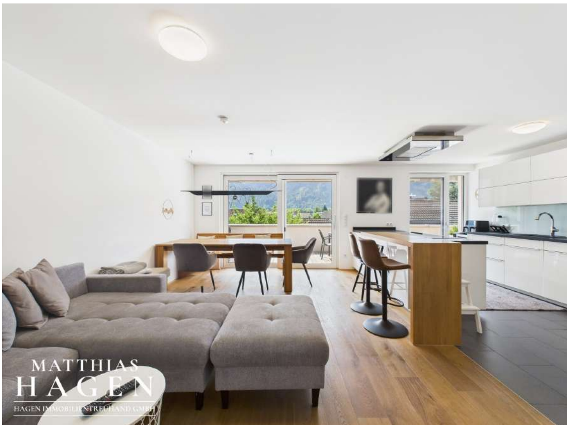
Wohnbereich und Küche