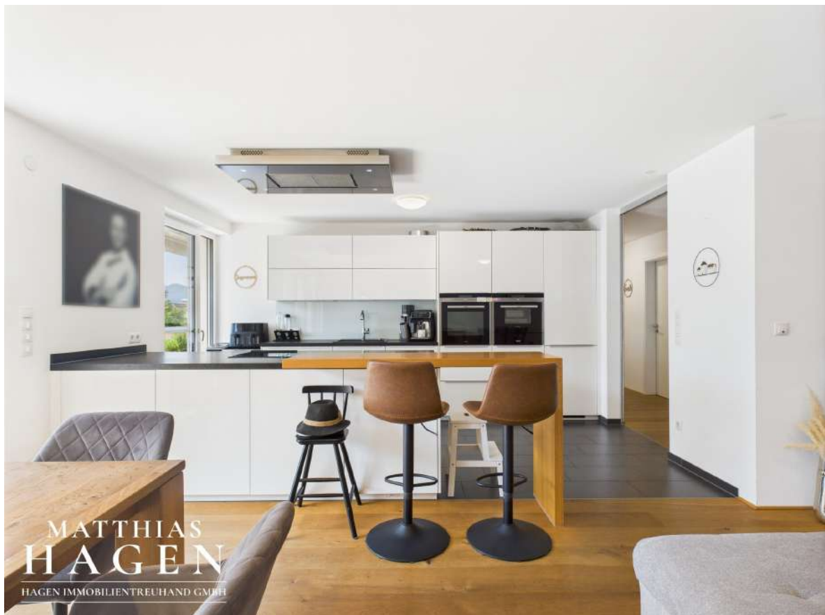
Wohnbereich und Küche