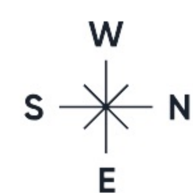
Etage -1 Gebäude 1