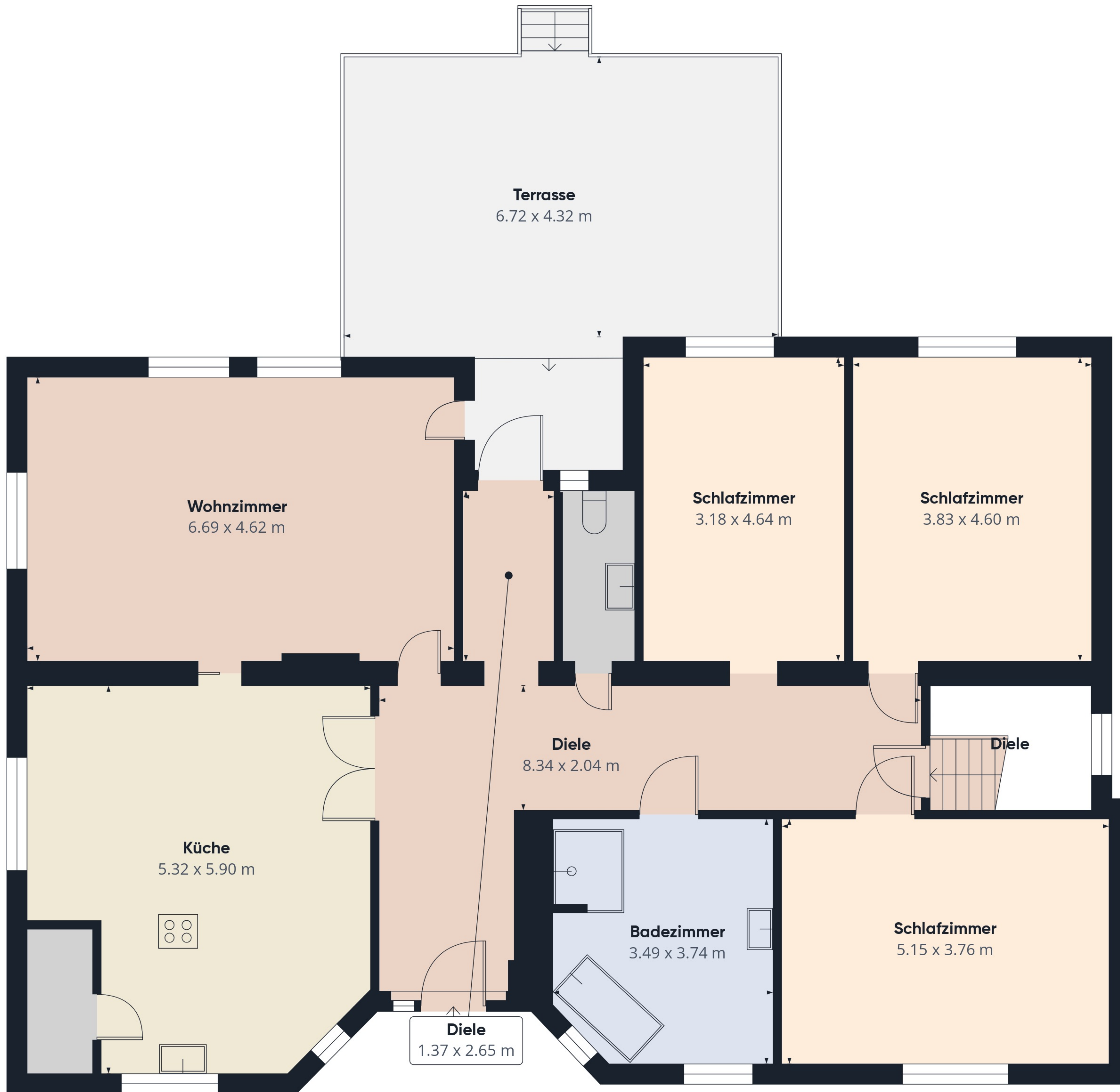
Etage 0 Gebäude 1