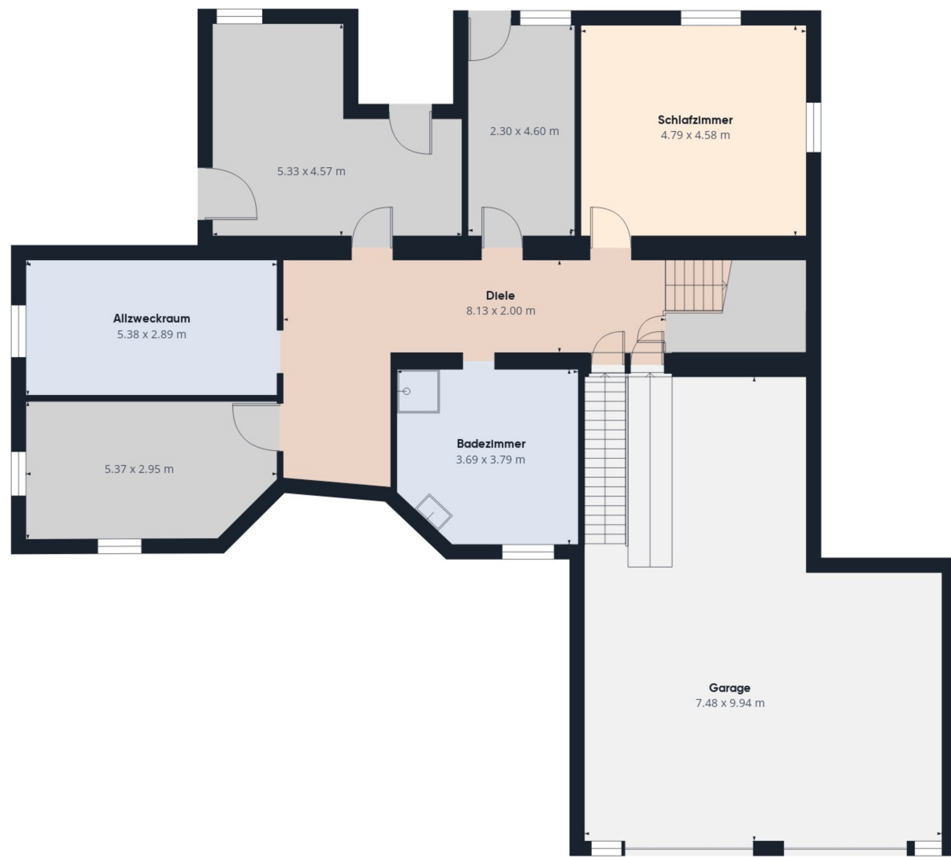
Etage -1 Gebäude 1