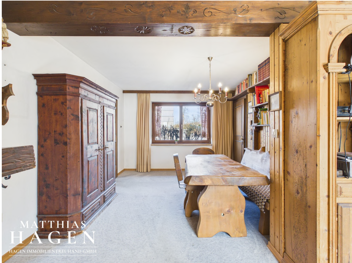
Wohn/Essbereich - OG