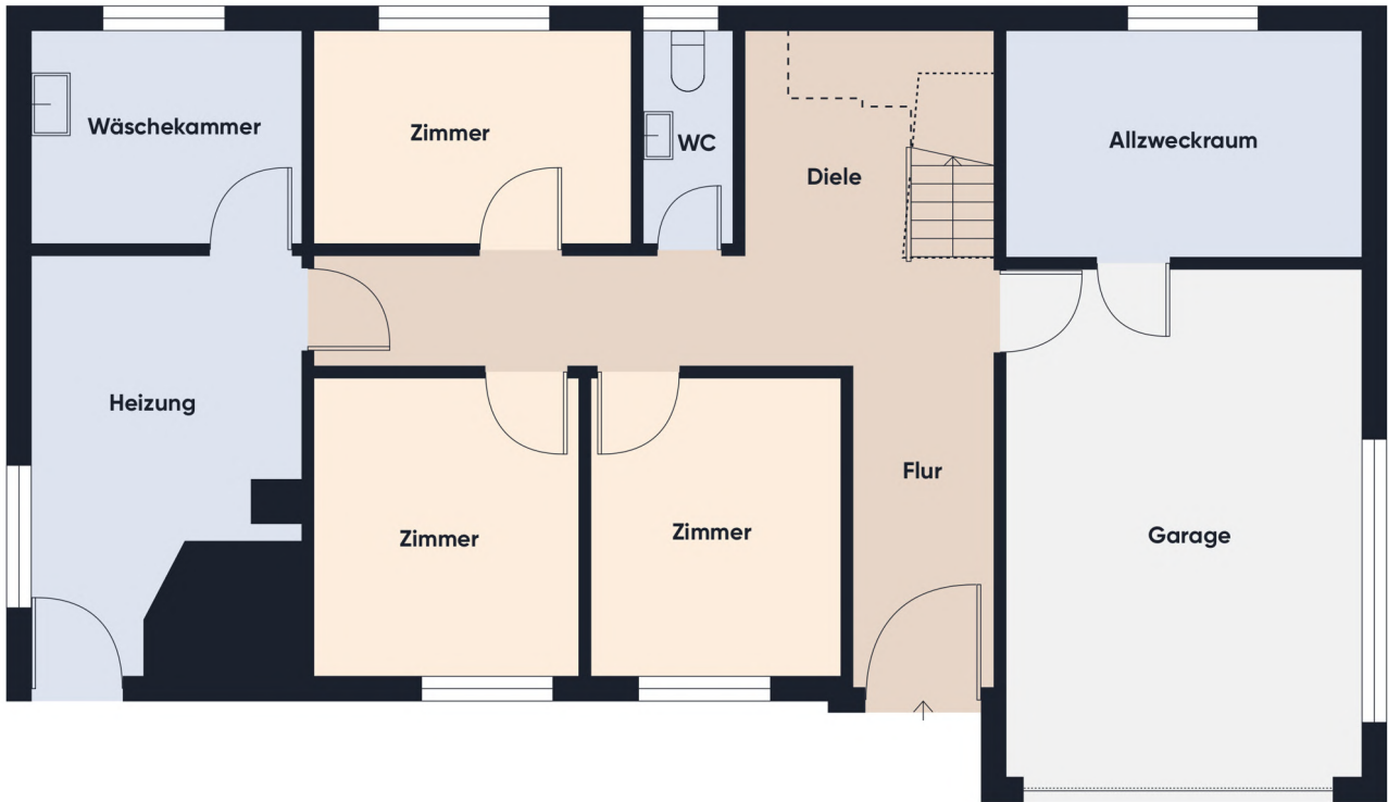
Grundrissplan ohne Maßstab EG