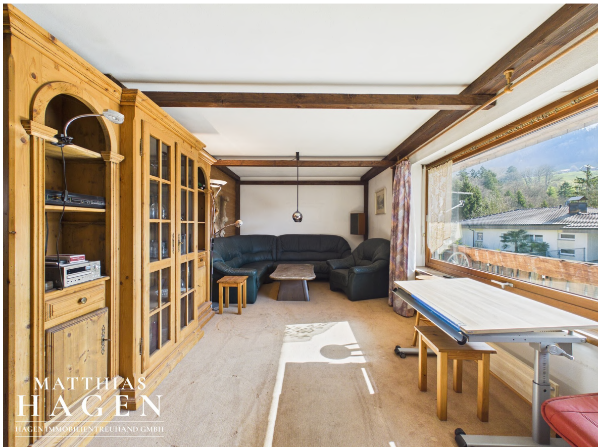
Wohnzimmer - OG