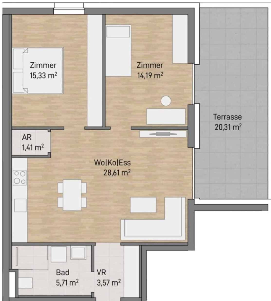
▲ TOP 03 68,82 m 2