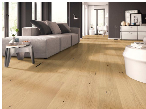
Landhausdiele Eiche kraftvoll, natur geölt