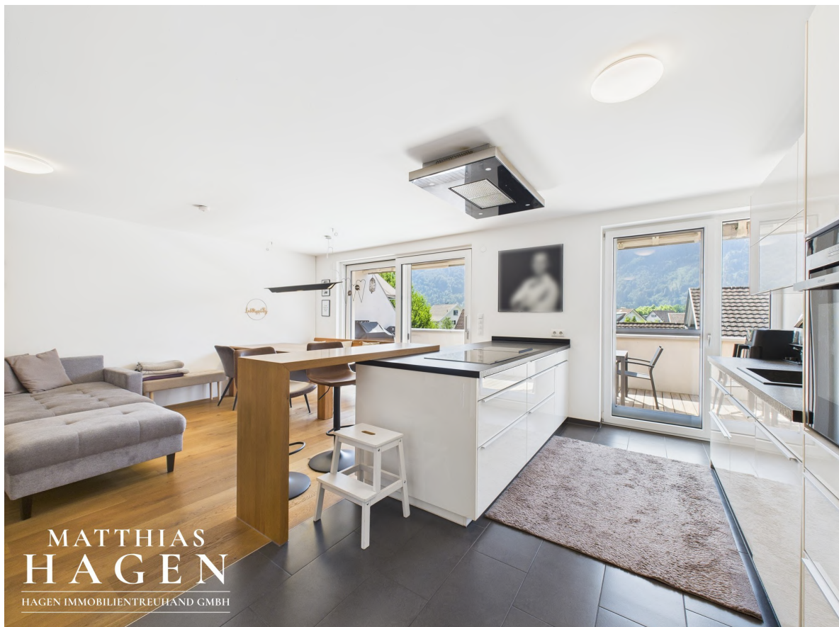
Wohnbereich und Küche