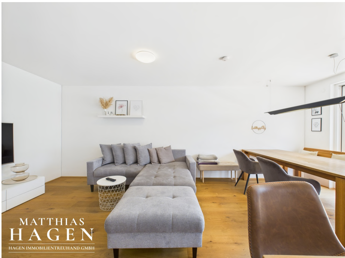
Wohnbereich und Küche