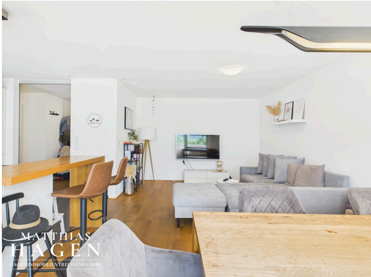
Wohnbereich und Küche