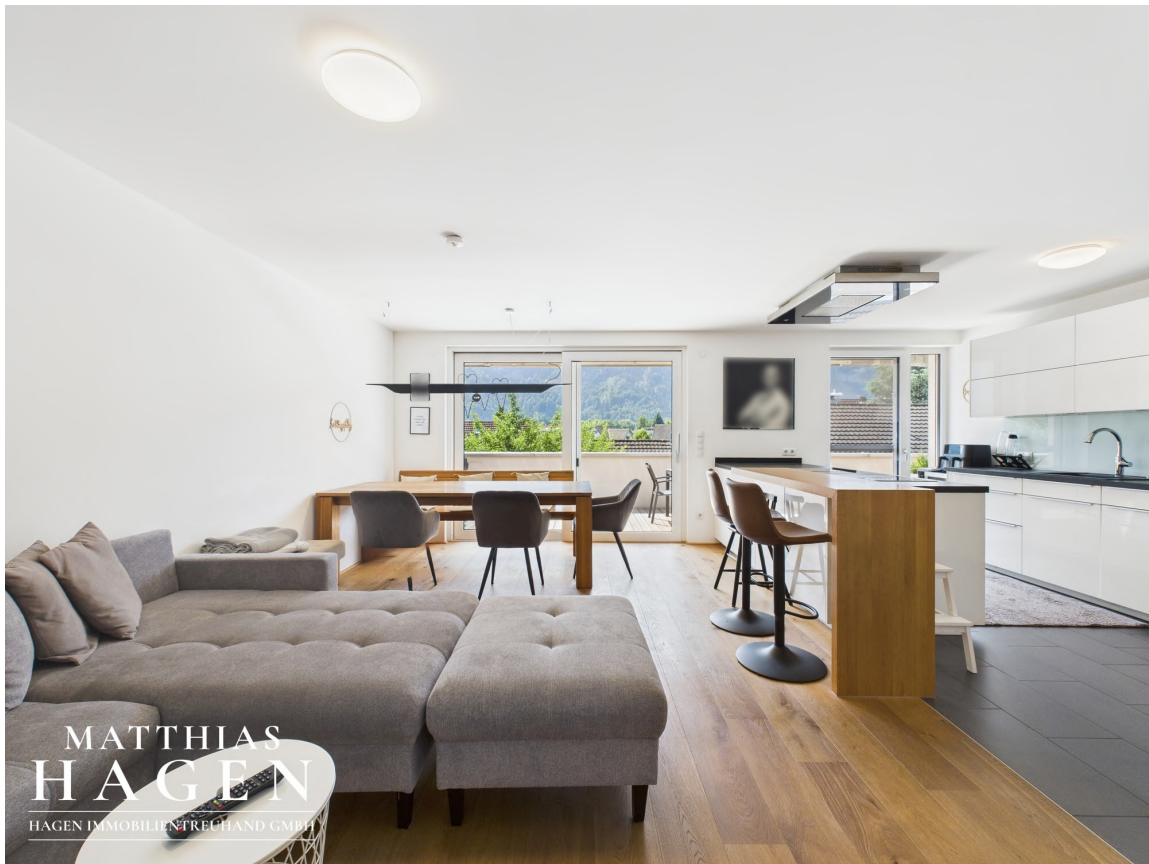
Wohnbereich und Küche