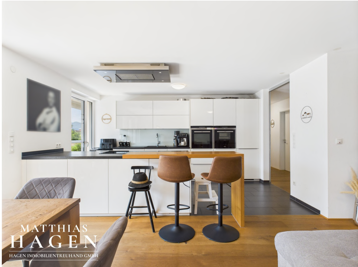
Wohnbereich und Küche