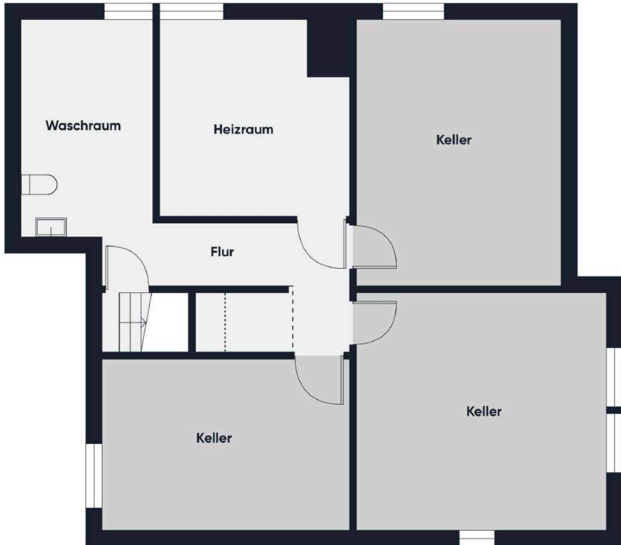
Grundrissplan ohne Maßstab KG