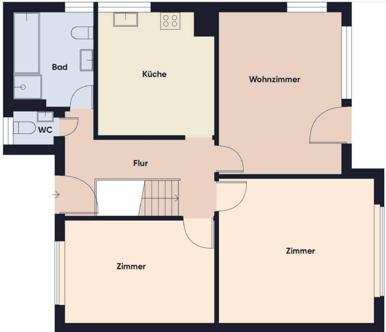
Grundrissplan ohne Maßstab EG