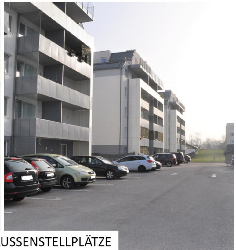
TIEFGARAGE UND AUSSENSTELLPLÄTZE